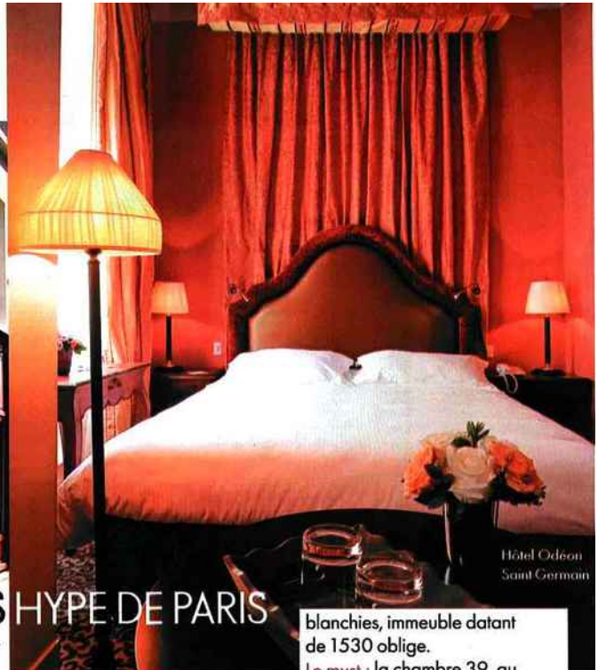
Hôtel Odéon Saint-Germain